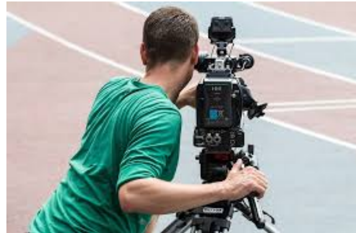
Programma 1 Wat beweegt jou?

Van alle kosten ontvangt u een factuur met als omschrijving: Onkosten.