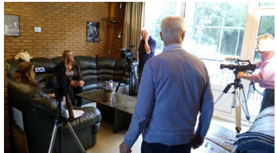
Programma 2 Wat doe je voor de kost?